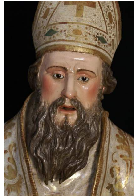
"San Martín de Tours" Parroquia de San Martín de Tours (Carrión de los Céspedes, Sevilla).

REDACCIÓN, DIRECCIÓN Y EJECUCIÓN de los trabajos de conservación-restauración sobre una escultura en madera policromada tamaño académico representando a "Niño Jesús" . Anónimo s.XVIII. Propiedad particular. Moguer (Huelva) Año 2013.