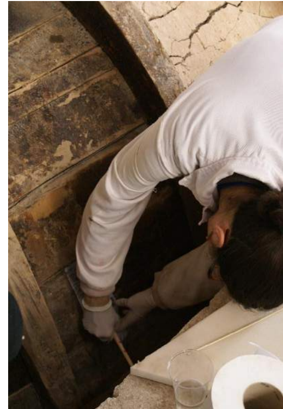
Trabajos sobre los soportes de madera de la "Sala de los Reyes" de la Alhambra (Granada).

EJECUCIÓN del PROYECTO de intervención de los soportes de madera de las pinturas sobre cuero de la Sala de los Reyes de la Alhambra. Anónimo, s.XIV en colaboración con el Instituto Andaluz de Patrimonio Histórico (IAPH). Patronato de la Alhambra y el Generalife. Consejería de Cultura. Junta de Andalucía. Mayo-Diciembre 2008.