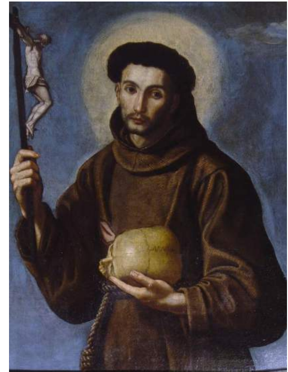
"San Francisco de Asís" Parroquia de Santa María Magdalena (Villamanrique de la Condesa, Sevilla).

REDACCIÓN, DIRECCIÓN Y EJECUCIÓN de los trabajos de conservaciónrestauración sobre un óleo sobre lienzo denominado "Retrato. Sra. de Abascal" . Antonio Luis 1939. Propiedad Particular. Sevilla. Año 2006.