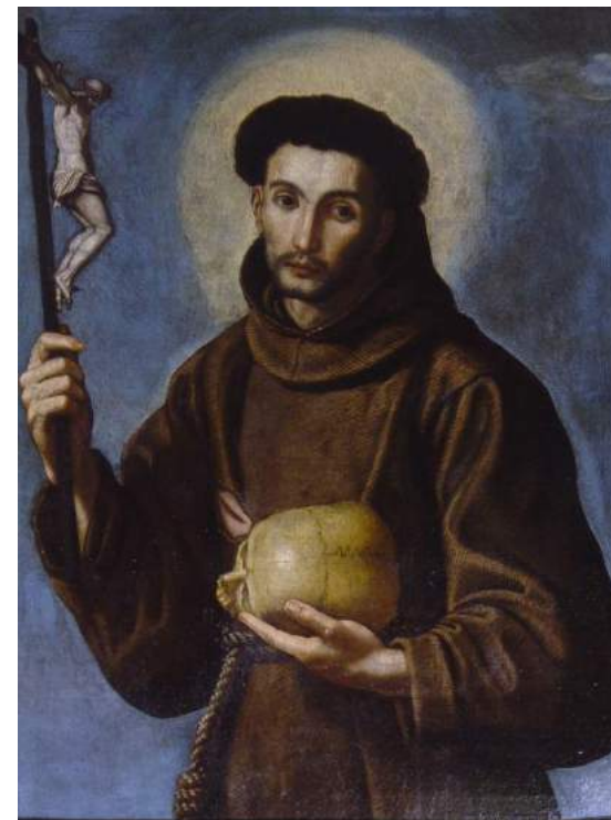
"San Francisco de Asís" Parroquia de Santa María Magdalena (Villamanrique de la Condesa, Sevilla).

REDACCIÓN, DIRECCIÓN Y EJECUCIÓN de los trabajos de conservación-restauración sobre el óleo sobre lienzo denominado "San Ignacio de Loyola" . Anónimo. S.XVIII. Comunidad de PP. Jesuitas "Sagrado Corazón". Granada. Enero-Abril 2012.