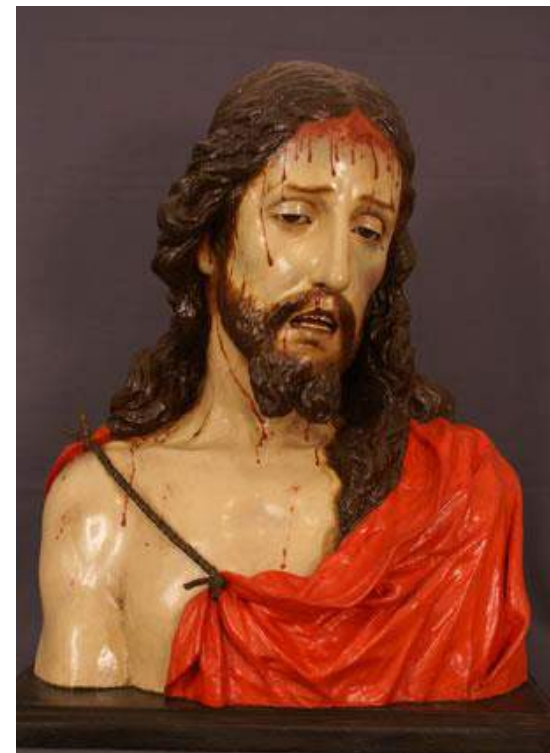
"Ecce-Homo" (Cabra, Córdoba).

DIRECCIÓN Y EJECUCIÓN de la intervención sobre la escultura en madera policromada denominada "Ecce-Homo" . Anónimo, Atr. Torcuato Ruiz del Peral. S.XVII. para la exposición itinerante celebrada en Cabra (Córdoba) dentro del programa "ANDALUCÍA BARROCA". Dirección General de Bienes Culturales. Consejería de Cultura. Junta de Andalucía. Octubre-Noviembre 2009. Exp. nº B 09 2298 SV 14 BC.