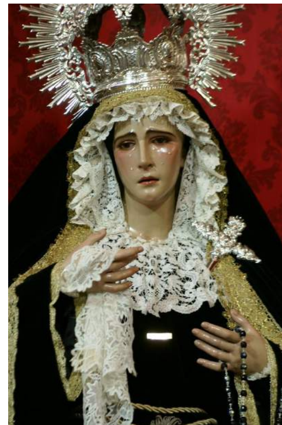
"Ntra. Sra. de los Dolores" Hdad. de la Vera Cruz (Guillena, Sevilla).

REDACCIÓN, DIRECCIÓN Y EJECUCIÓN de los trabajos de conservación-restauración sobre una escultura en madera policromada denominada "Virgen del Rosario" . Anónimo s.XVIII. Parroquia de Ntra. Sra. del Rosario. Las Pajanosas (Guillena, Sevilla). Mayo-Agosto 2016.