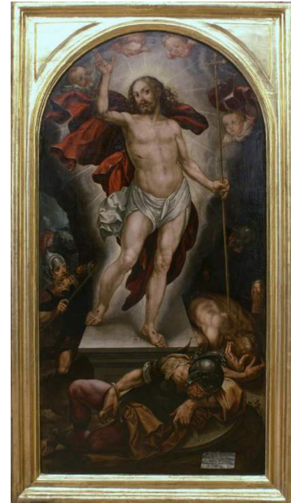
"La Resurrección" Real Parroquia de Santa Ana de Triana (Sevilla).