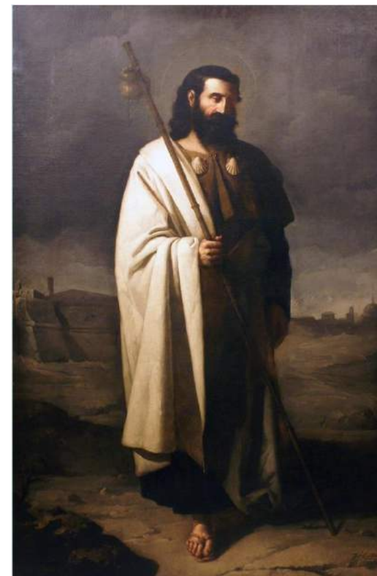
"Santiago Apóstol" Capilla del Dulce Nombre de Jesús (Sevilla).

TRATAMIENTO DE CONSERVACIÓN sobre un óleo sobre lienzo denominado "Cristo de la Vera Cruz" . Antonio Miguel Rodríguez Núñez, 2002. Hdad. de la Vera Cruz. Brenes (Sevilla). Julio - septiembre 2018.