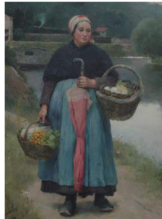
"La campesina de Pointose" Propiedad particular (Sevilla).

REDACCIÓN, DIRECCIÓN Y EJECUCIÓN de los trabajos de conservaciónrestauración sobre un temple sobre lienzo denominado "Bodegón" . Francisco Narbona. 1916. Propiedad particular. Sevilla. Año 2002.