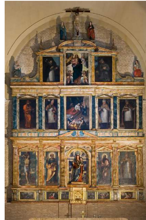
"Retablo Mayor" Parroquia de Ntra. Sra. de la Oliva (Salteras, Sevilla).

DIRECCIÓN DEL PROYECTO DE INTERVENCIÓN: "CONSERVACIÓN Y RESTAURACIÓN DEL RETABLO MAYOR DE LA IGLESIA DE SANTIAGO DE HERRERA" integrado en el proyecto global "Ruta de las Dos Andalucías" incluido en el EFTA. Ayuntamiento de Herrera (Sevilla). Febrero – Octubre de 2005.