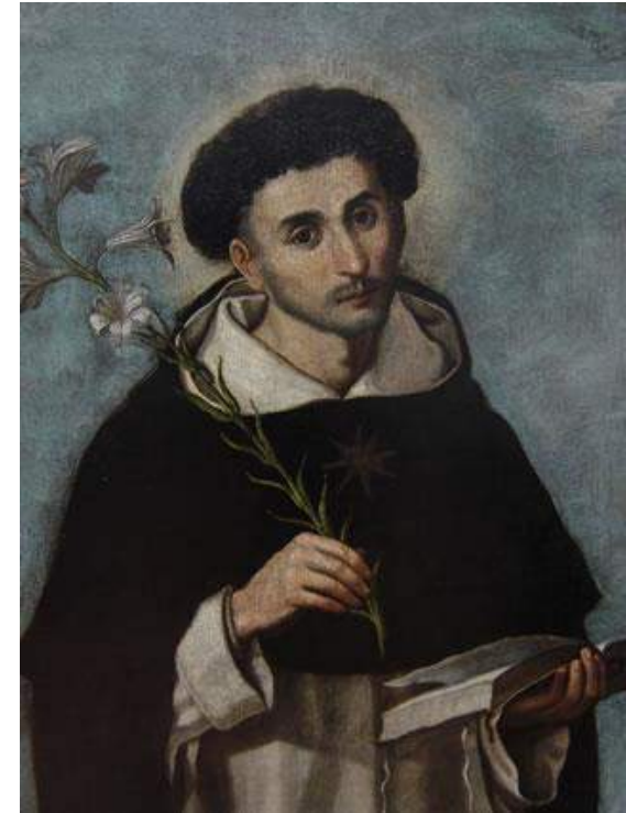
"Santo Domingo de Guzmán" Parroquia de Santa María Magdalena (Villamanrique de la Condesa, Sevilla).

REDACCIÓN, DIRECCIÓN Y EJECUCIÓN de los trabajos de conservaciónrestauración sobre un óleo sobre lienzo denominado "San Francisco de Asís" . Francisco Pacheco 1616/1619. Óleo sobre lienzo dentro del proyecto "RETABLO DE SAN JOSÉ" Parroquia de Sta. M a Magdalena. Villamanrique de la Condesa (Sevilla). Marzo-Abril 2007.