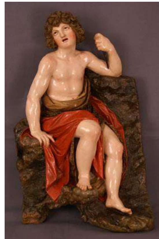
"San Juan Bautista" (Cabra, Córdoba).

REDACCIÓN, DIRECCIÓN Y EJECUCIÓN de los trabajos de conservación-restauración sobre una escultura en madera policromada denominada "San Sebastián" . Anónimo s.XVIII/Manuel Pineda Calderón 1949. Hdad. Sacramental de Ntra. Sra. de la Granada. Guillena (Sevilla). Octubre 2018- enero 2019.