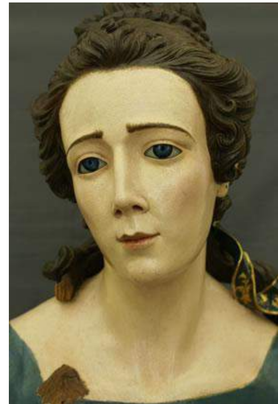
"Santa Polixena" Parroquia de Santa María (Écija, Sevilla).

DIRECCIÓN Y EJECUCIÓN de la intervención sobre la escultura en madera policromada denominada "San Wistremundo" . Anónimo, 1770 para la exposición itinerante dentro del programa "ANDALUCÍA BARROCA". Dirección General de Bienes Culturales. Consejería de Cultura. Junta de Andalucía. Febrero-Abril 2008.