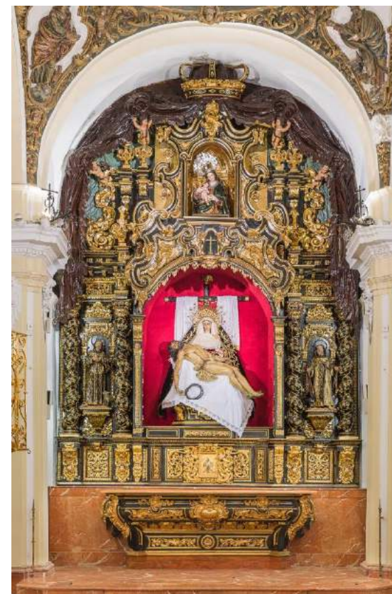
"Retablo Mayor" Capilla de la Piedad. Hdad. del Baratillo (Sevilla).

REDACCIÓN, DIRECCIÓN Y EJECUCIÓN del PROYECTO sobre el Retablo en madera dorada y policromada y las pinturas que lo conforman denominado "Sagrado Corazón" . Autor anónimo. S.XVII. Parroquia de Sta. M a de la Oliva. Salteras (Sevilla). Marzo-Agosto 2009.