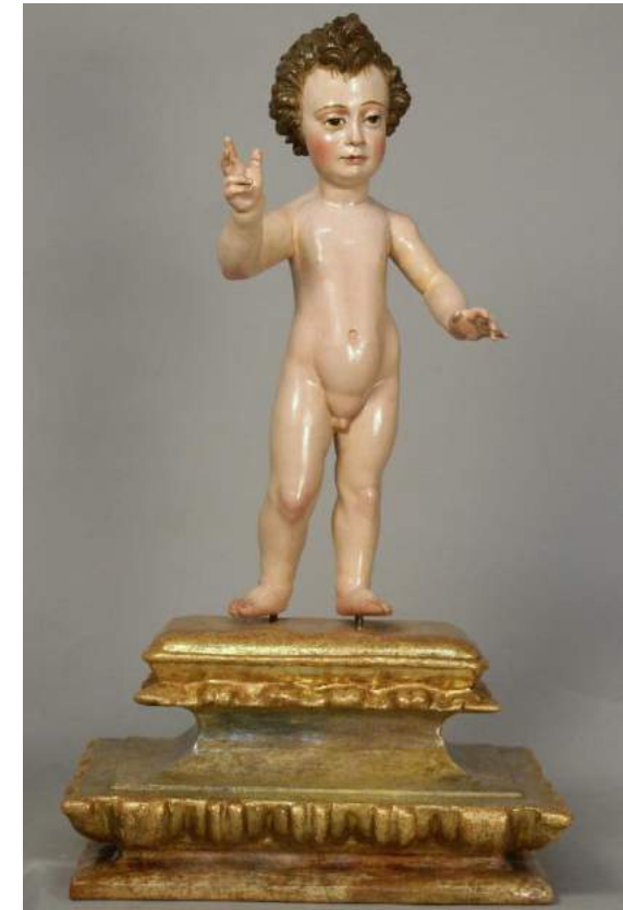
"Niño Jesús" Parroquia de Ntra. Sra. de la Asunción (Alcalá del Río, Sevilla).

REDACCIÓN, DIRECCIÓN Y EJECUCIÓN del PROYECTO, MEMORIA y PROCESO DE INTERVENCIÓN sobre la escultura de candelero en madera policromada denominada "Virgen del Carmen" . Anónimo. S.XVII. Parroquia de Ntra. Sra. de la Victoria. Morón de la Frontera (Sevilla). Septiembre – Diciembre 2004.