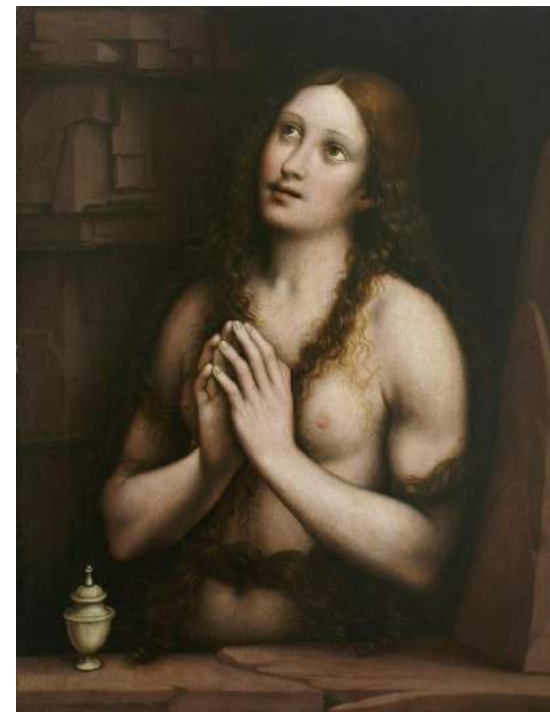
"María Magdalena" Propiedad particular (Sevilla).

REDACCIÓN, DIRECCIÓN Y EJECUCIÓN de los trabajos de conservación-restauración sobre el óleo sobre lienzo denominado "Santiago Apóstol" . José Contreras, 1865. Capilla del Dulce Nombre de Jesús. Hermandad de la Vera Cruz. Sevilla. Septiembre 2015-Enero 2016.