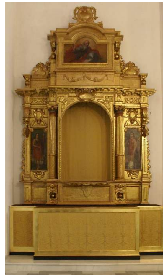
"Retablo de la Inmaculada Concepción" Parroquia de Ntra. Sra. de la Granada (Guillena, Sevilla).

REDACCIÓN, DIRECCIÓN Y EJECUCIÓN del PROYECTO sobre el Retablo Mayor en madera dorada y policromada y las esculturas que lo conforman. Miguel González Guisado, 1793. Parroquia de Sta. M a de la Asunción. Huévar del Aljarafe (Sevilla). Excmo. Ayuntamiento de Huévar del Aljarafe. Diciembre 2006 – Mayo 2007.